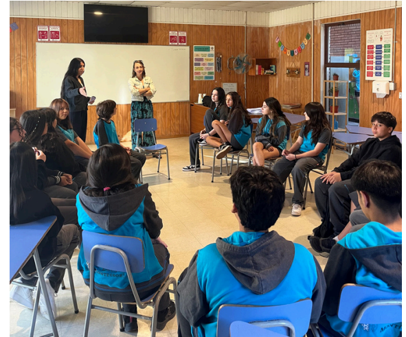
El mes de marzo en un período de normalización y de nuevas rutinas de aprendizaje

Cuando uno observa un ambiente de aprendizaje normalizado, las características que se pueden visibilizar son la concentración, el amor por el trabajo, una disciplina interior, colaboración entre pares, respeto por lo demás, bienestar y sentido de pertenencia.