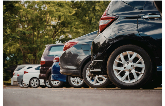
Con pequeños gestos, nos cuidamos entre todos. #SomosKimen

Asimismo, es fundamental usar el sticker distintivo del colegio en sus vehículos, los que están disponibles de forma permanente en portería, para ser retirados y facilitan la identificación y el control de acceso.